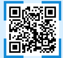
中高生キャンプ 申込みQRコード