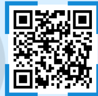
小学生Jrキャンプ 申込みQRコード